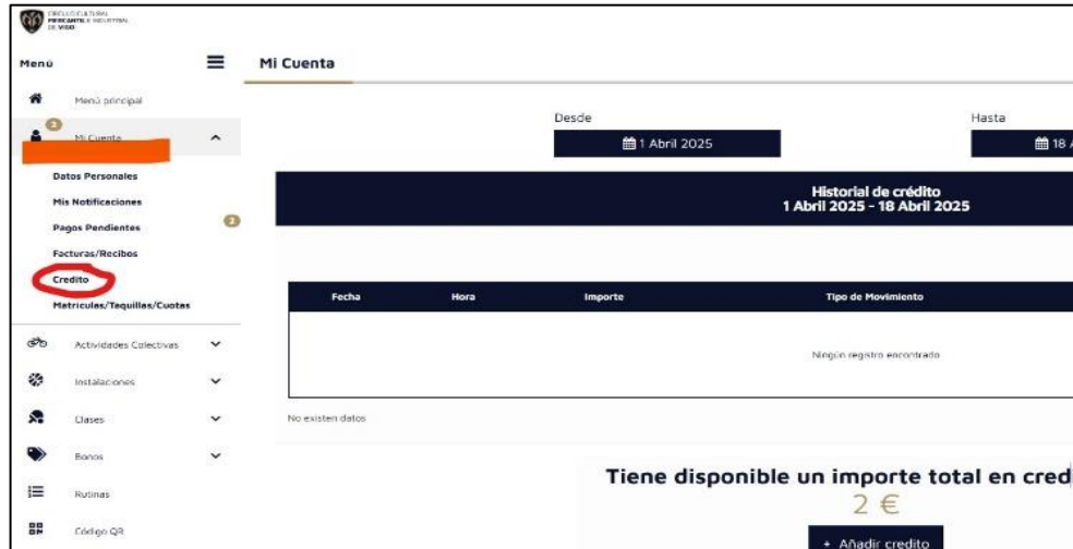
Pestaña 'crédito', dentro del menú 'Mi cuenta'