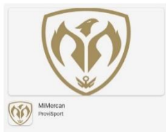
PlayStore / AppleStore